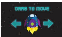
El cohete del tiempo