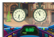
Hora y media hora

Los jugadores practican cómo leer la hora en distintos intervalos: de hora, de media hora, de cuarto de hora y de cinco minutos.