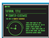
Modo de aprendizaje

Los jugadores aprenden el significado de a. m. y p. m., la diferencia entre el sentido horario y el sentido antihorario, y a reconocer la hora en relojes digitales y analógicos.