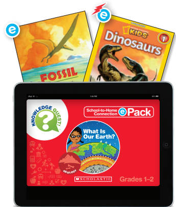
What Is Our Earth? ePack