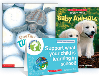
Life Cycles Pack

¡Leer en voz alta con su hijo al menos 20 minutos cada día! Leer en voz alta a su hijo es tan importante como que ellos mismos practiquen la lectura, ya que es una manera más rápida de incorporar a profundidad conocimiento y vocabulario. Los paquetes de libros impresos y libros electrónicos de School-to-Home Connection ofrecen oportunidades sencillas para respaldar lo que su hijo está aprendiendo en la escuela. Estos paquetes se correlacionan con la colección que estamos usando actualmente en clases para ayudar a su hijo a tener éxito en la escuela.