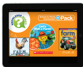
Let's Visit a Farm! ePack