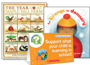
Let's Visit a Farm! Pack

¡Leer en voz alta con su hijo al menos 20 minutos cada día! Leer en voz alta a su hijo es tan importante como que ellos mismos practiquen la lectura, ya que es una manera más rápida de incorporar a profundidad conocimiento y vocabulario. Los paquetes de libros impresos y libros electrónicos de School-to-Home Connection ofrecen oportunidades sencillas para respaldar lo que su hijo está aprendiendo en la escuela. Estos paquetes se correlacionan con la colección que estamos usando actualmente en clases para ayudar a su hijo a tener éxito en la escuela.