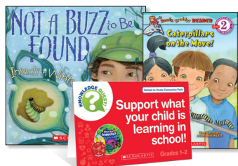
What Are Insects? Pack

¡Leer en voz alta con su hijo al menos 20 minutos cada día! Leer en voz alta a su hijo es tan importante como que ellos mismos practiquen la lectura, ya que es una manera más rápida de incorporar a profundidad conocimiento y vocabulario. Los paquetes de libros impresos y libros electrónicos de School-to-Home Connection ofrecen oportunidades sencillas para respaldar lo que su hijo está aprendiendo en la escuela. Estos paquetes se correlacionan con la colección que estamos usando actualmente en clases para ayudar a su hijo a tener éxito en la escuela.