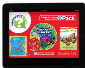
What Are Insects? ePack