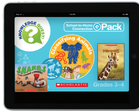
Classifying Animals ePack