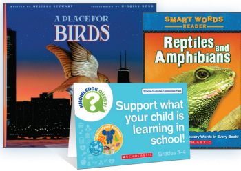
Classifying Animals Pack

¡Leer en voz alta con su hijo al menos 20 minutos cada día! Leer en voz alta a su hijo es tan importante como que ellos mismos practiquen la lectura, ya que es una manera más rápida de incorporar a profundidad conocimiento y vocabulario. Los paquetes de libros impresos y libros electrónicos de School-to-Home Connection ofrecen oportunidades sencillas para respaldar lo que su hijo está aprendiendo en la escuela. Estos paquetes se correlacionan con la colección que estamos usando actualmente en clases para ayudar a su hijo a tener éxito en la escuela.