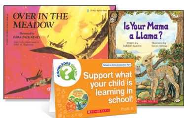
Animals and Their Needs Pack

¡Leer en voz alta con su hijo al menos 20 minutos cada día! Leer en voz alta a su hijo es tan importante como que ellos mismos practiquen la lectura, ya que es una manera más rápida de incorporar a profundidad conocimiento y vocabulario. Los paquetes de libros impresos y libros electrónicos de School-to-Home Connection ofrecen oportunidades sencillas para respaldar lo que su hijo está aprendiendo en la escuela. Estos paquetes se correlacionan con la colección que estamos usando actualmente en clases para ayudar a su hijo a tener éxito en la escuela.