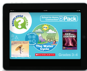
The Water Cycle ePack